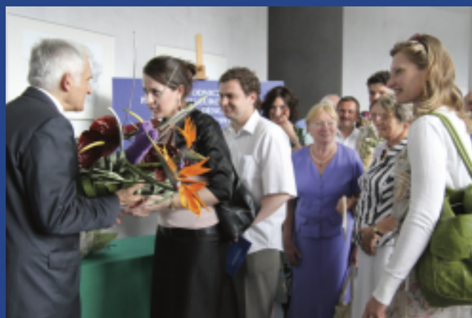
Gratulacje od rodziny