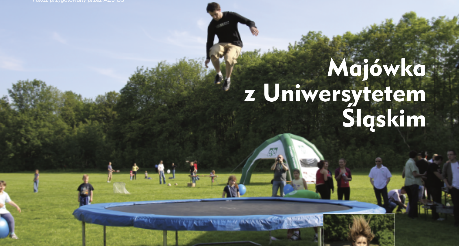
Pokaz przygotowany przez AZS UŚ