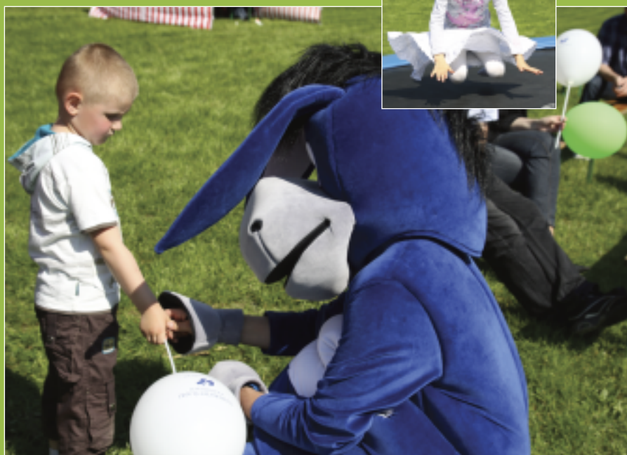
„Gościem” specjalnym Majówki była maskotka Uniwersytetu Śląskiego – Usiołek