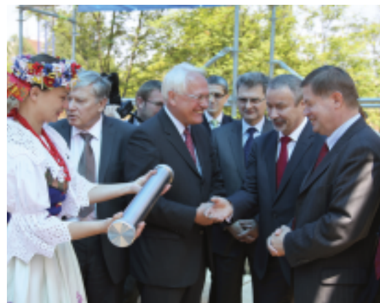
Wmurowanie kamienia węgielnego