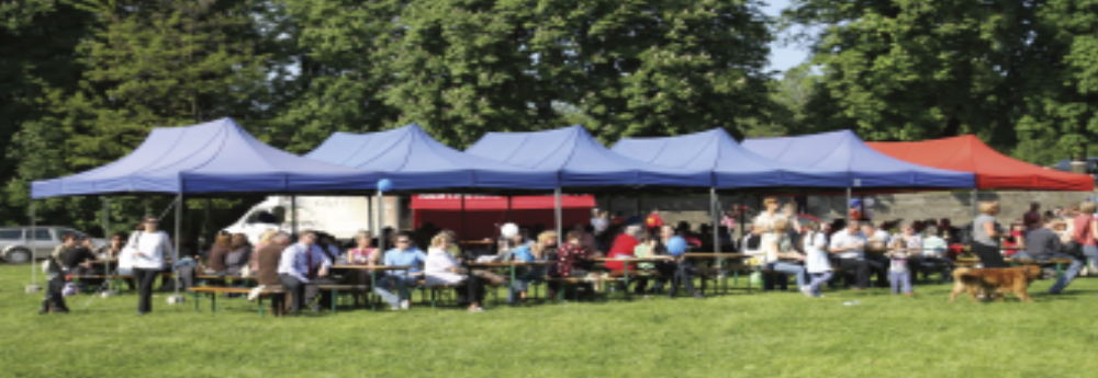
28 maja przy Szkole Zarządzania UŚ w Chorzowie odbyła się coroczna impreza plenerowa - Majówka z Uniwersytetem Śląskim